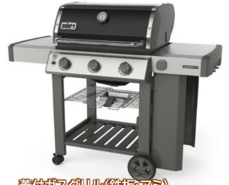
蓋付ガスグリル(鉄板・アミ)

【電車・高速バスでご来場の方に】 現地での買い物！観光！に最適！ 併設するあそびの基地NOAにて【カーシェア】【レンタサイクル】をご用意しております。