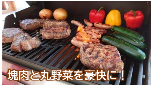
塊肉と丸野菜を豪快に！

○スタンダードプラン○¥5,500 牛肉・豚肉・鶏肉・ソーセージ 丸野菜・スープ・バケット