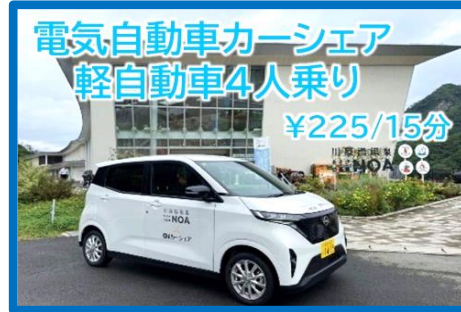
電気自動車カーシェア 軽自動車4人乗り