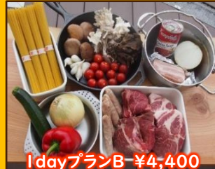
1 dayプランB ¥4,400

群馬の嬉嬉豚 牛の塊肉 嬉嬉豚のソーセージ 季節の丸ごと野菜 季節のアーヒージョ スープ パスタorバケット(季節により変更)