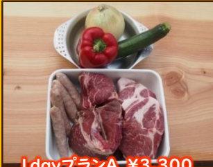
1 dayプランA ¥3,300